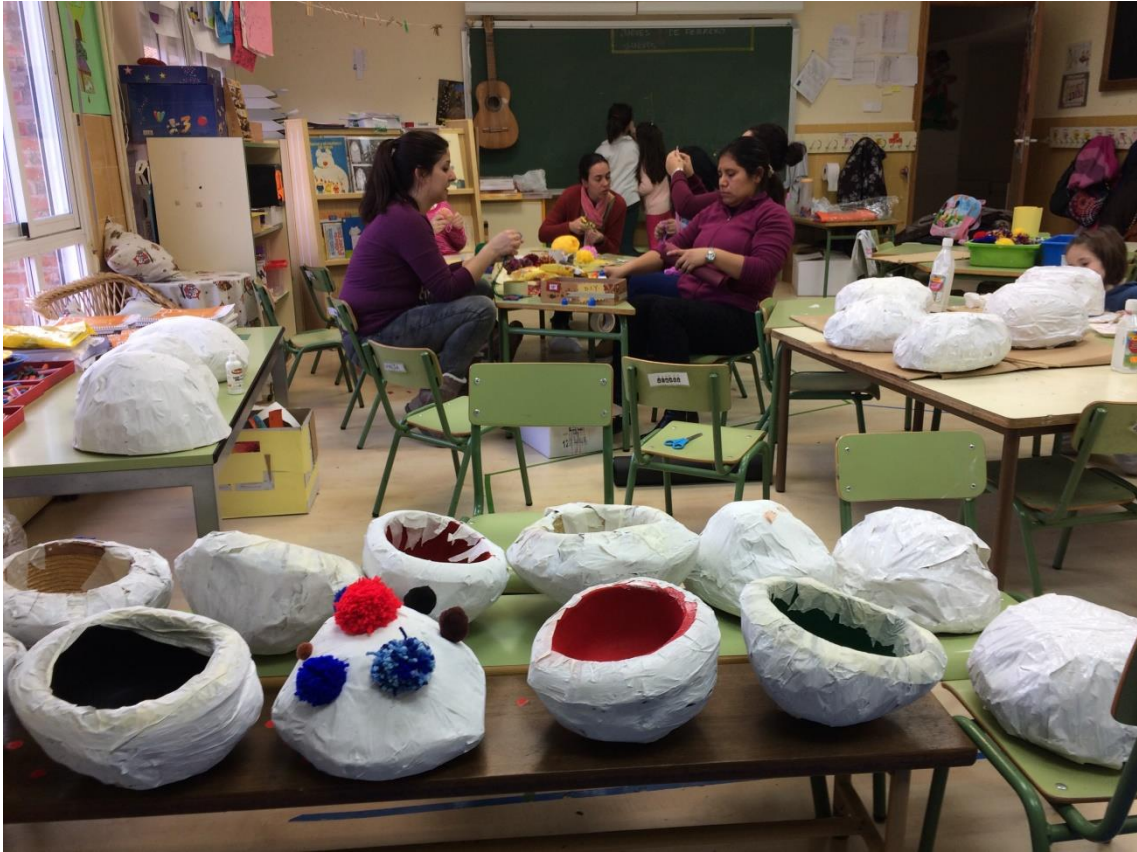
Taller de elaboración de gorros de botargas para el desfile de Carnaval.