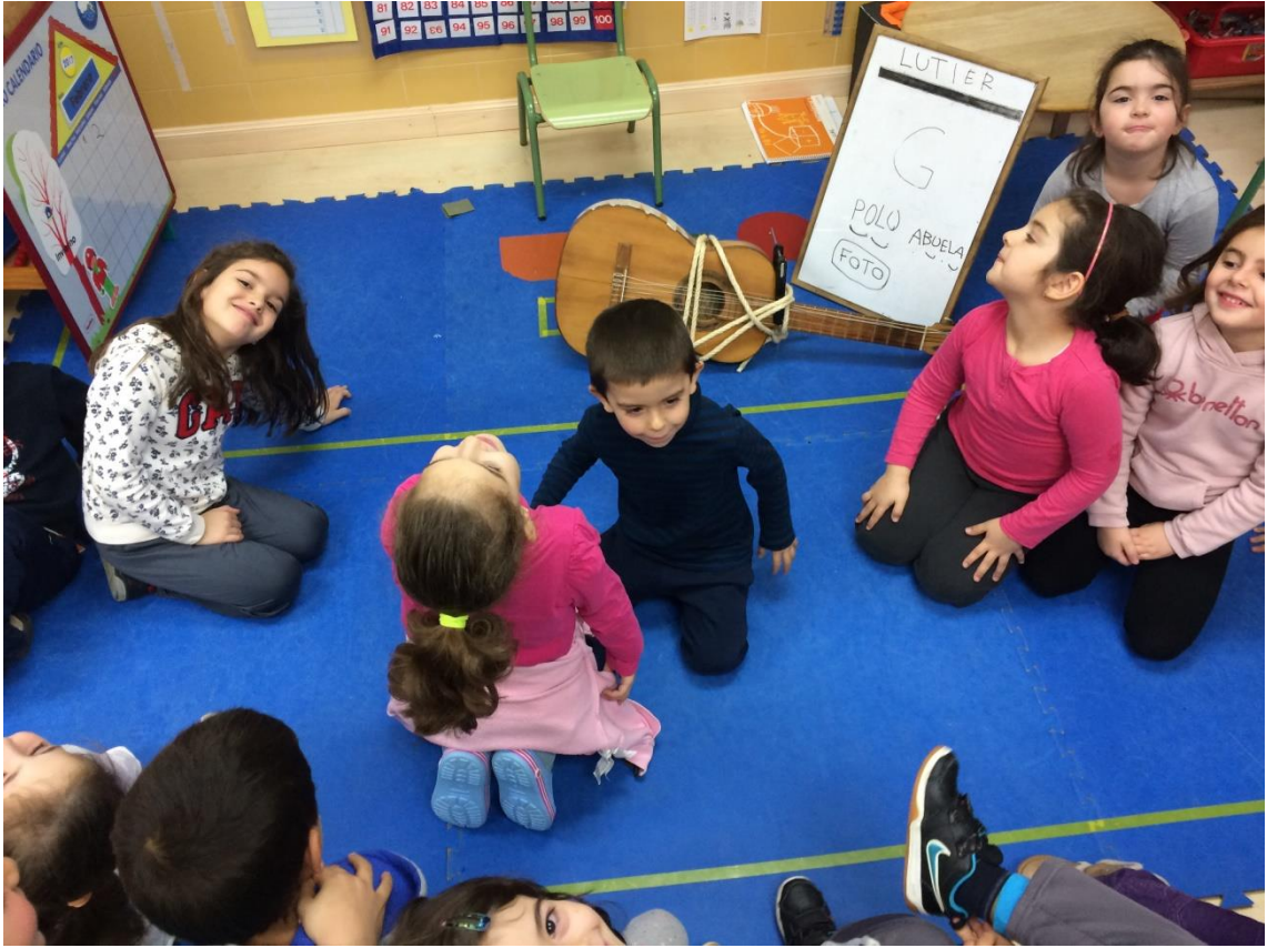
Taller de restauración.